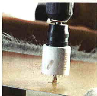
Progressor de snelle