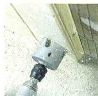
Multi-Construction de veelzijdige